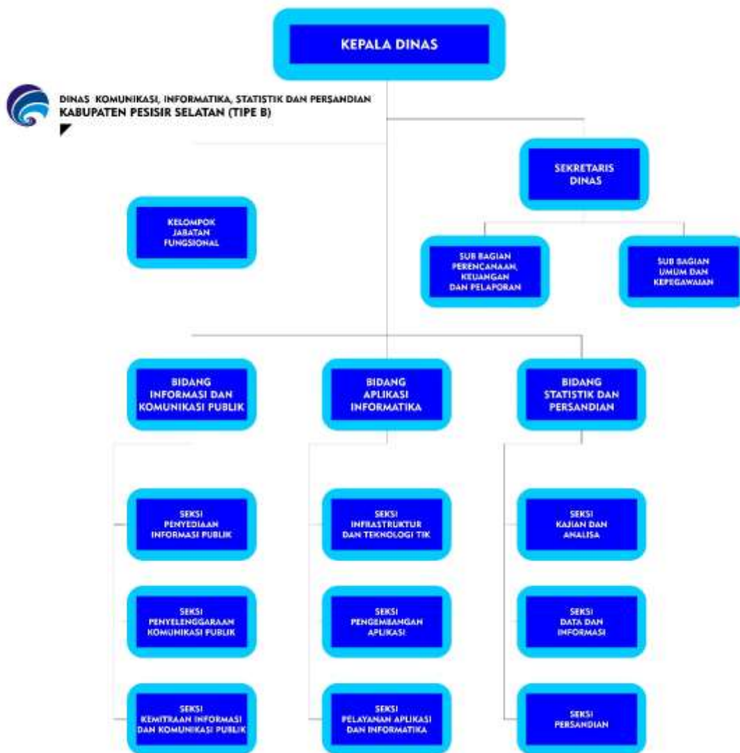
Gambar 1.1 Struktur Organisasi Dinas KOMunikasi dan Informatika Kabupaten Pesisir Selatan